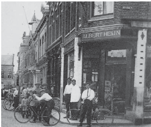
De winkel die Albert Heijn in 1895 in Purmerend opende (foto omstreeks 1900).