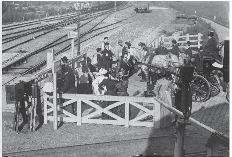
Een spoorwegovergang in Amsterdam in 1900.

In grote steden kwamen trams. Eerst werden die over de rails getrokken door paarden. Later kwamen er stoomtrams en nog weer later elektrische trams. Een ander nieuw vervoermiddel was de fiets, die vooral in ons land belangrijk werd.