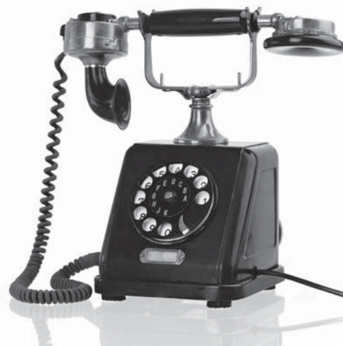
Een oude telefoon.

mogelijk tussen mensen die op afstand van elkaar zijn. In het begin was telefoneren ingewikkeld, omdat het toestel aangesloten moest zijn op een telefoonlijn. Iedere stad had een eigen netwerk, dus bellen naar een andere stad kon niet. Het duurde een hele tijd voordat de telefoonnetten op elkaar waren aangesloten. Nederlanders konden bijvoorbeeld pas in 1895 bellen naar iemand in België.