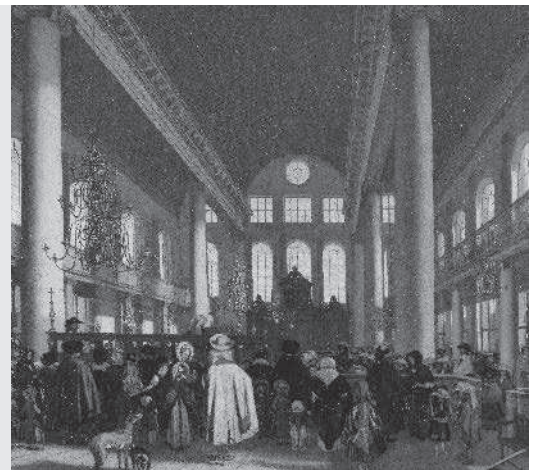
Opening van de Portugese Synagoge in Amsterdam.

De Republiek was blij met de nieuwkomers uit de Zuidelijke Nederlanden, Portugal en Spanje. Veel kooplieden namen hun kapitaal mee. Ambachtslieden kwamen met hun vakkennis en maakten hier mooie dingen. Uit Duitsland kwamen vooral arme mensen hiernaartoe. Zij waren op zoek naar werk en hogere lonen. Al deze migranten droegen bij aan het succes van de Gouden Eeuw.