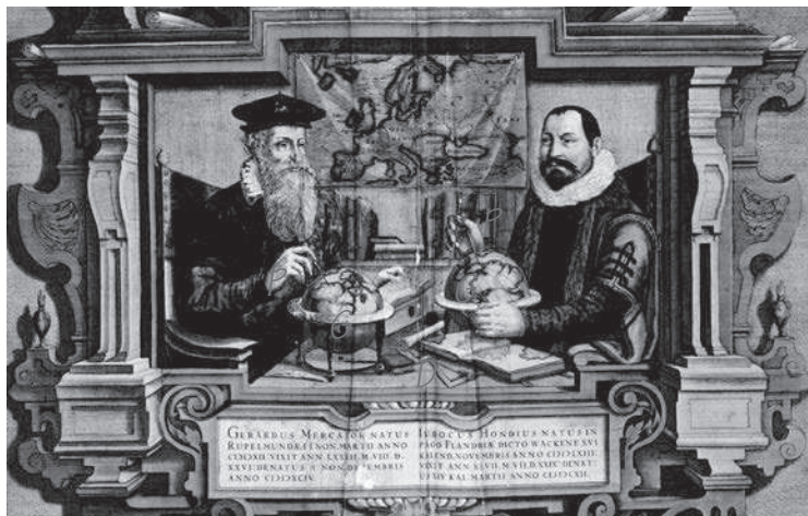
Nederlandse kaartenmakers Mercator en Hondius aan het werk.