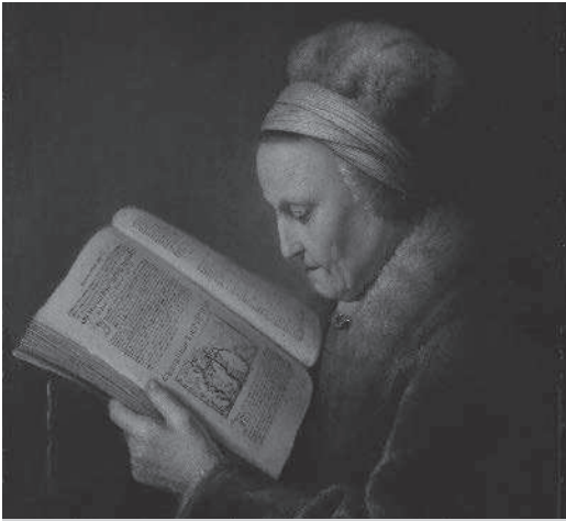
Een protestantse vrouw leest in de bijbel (1635).