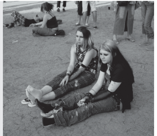
Veel pubers willen zelf bepalen wat ze leuk vinden en wat goed voor ze is.

een jas aantrekt of een sjaal omdoet. Soms maak je een opmerking die ze brutaal vinden en krijg je ruzie. Zo ontdek je wat je belangrijk vindt en leer je keuzes maken. Van al die geestelijke veranderingen kun je onzeker worden. Het ene moment ben je dolgelukkig, het volgende moet je huilen of ben je boos. Je reageert heftig en hebt wisselende stemmingen . Misschien word je voor het eerst echt verliefd.