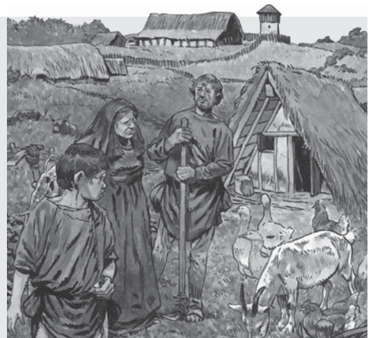
Horigen wonen en werken op het land van hun heer.

Een deel ervan moesten ze ook als belasting afstaan aan hun heer. Spullen die ze over hadden konden ze ruilen met andere boeren. Geld hadden ze bijna niet, maar dat hadden ze ook niet nodig. Handel was er bijna niet in die tijd.