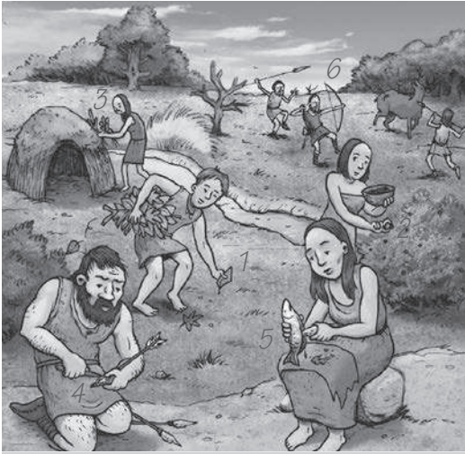
Ieder heeft zijn eigen taak.