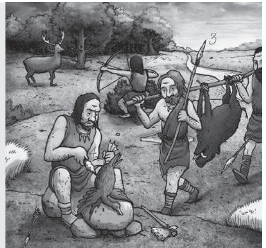
Jager-verzamelaars op zoek naar voedsel.

Archeologen hebben op die plekken gereedschap teruggevonden zoals bijlen, pijlen en visgerei. Zelfs stukken van kano's zijn gevonden. Restjes van fruit en botjes van watervogels en vissen vertellen ons ook hoe de mensen leefden.