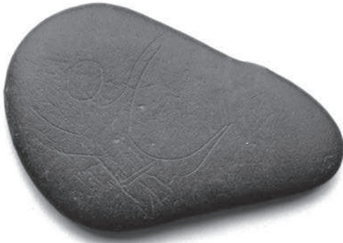
Danser op een steen uit de tijd van jagers en boeren.