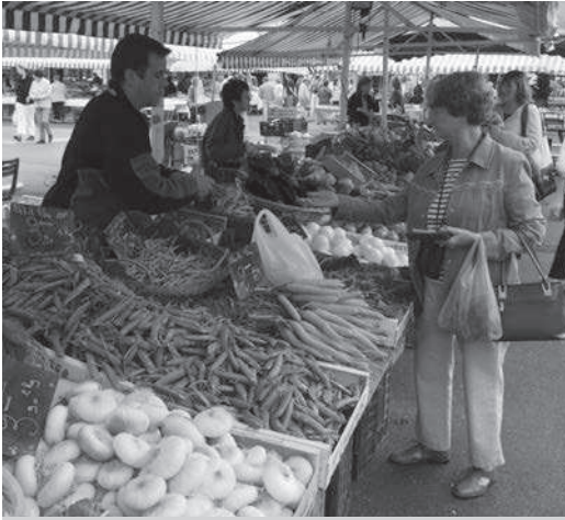
Op deze markt in Zuid-Frankrijk verkoopt een boer zijn groenten.