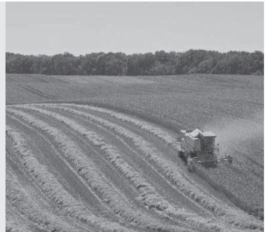
Met een grote maaidorser wordt het graan geoogst.

verbouwen van graan. Er zijn gigantisch grote graanakkers en met enorme machines wordt het graan geoogst. De akkers zijn eigendom van grote landbouwbedrijven. We zeggen ook wel: van grote boeren . Zoveel graan hebben de Fransen zelf niet nodig. Het meeste verkopen de boeren aan andere landen, zoals Nederland. Dat heet export . Ook boeren en tuinders in andere landen doen aan export, bijvoorbeeld van aardbeien en tomaten.