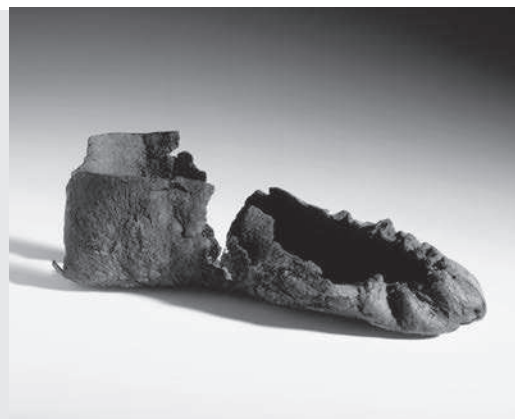
Een leren schoen van ongeveer 4000 jaar oud.

op vochtige plaatsen zoals het veen. Daar was vaak laaghangende mist en dat zag er geheimzinnig uit. Vroeger dachten de mensen dat daar goden of geesten waren. De voorwerpen waren niet verloren, maar achtergelaten als geschenk. Misschien als offer om hulp te krijgen, of om te bedanken voor een goede oogst of het beter worden van een ziekte, of om nog een andere reden. Dat vertelt de schoen niet.