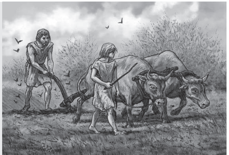
Met een ploeg wordt de harde kleigrond losgemaakt.

Bij het bewerken van de akker kwam heel wat kijken. Eerst moest het terrein worden schoongemaakt: alle bomen en struiken werden weggehaald. In de harde kleiachtige bodem konden zaadjes moeilijk groeien. Om granen te kunnen zaaien moest de grond goed los zijn. Met de hand of met een stuk ijzer of hout hakten de eerste boeren harde klei in kleine stukken. Dat was een zwaar karwei. Ze ontdekten toen dat ze dit makkelijker konden doen door een zwaar stuk metaal door de grond te trekken. Hierbij konden de getemde dieren goed helpen, vooral runderen waren sterk en konden zo'n zware ploeg goed door het land trekken.