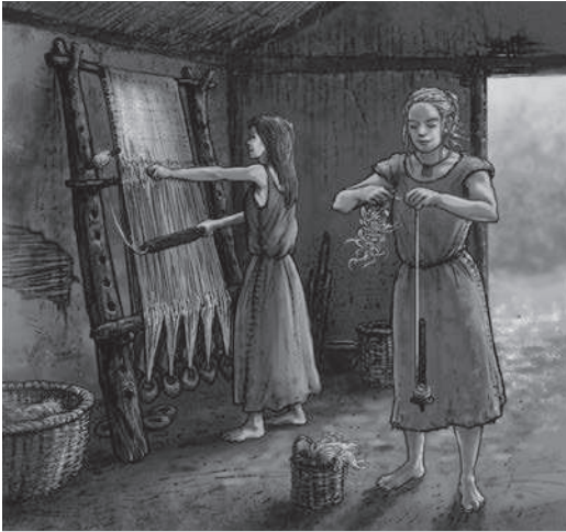
Spinnen met een spintol en weven op een weefgetouw.