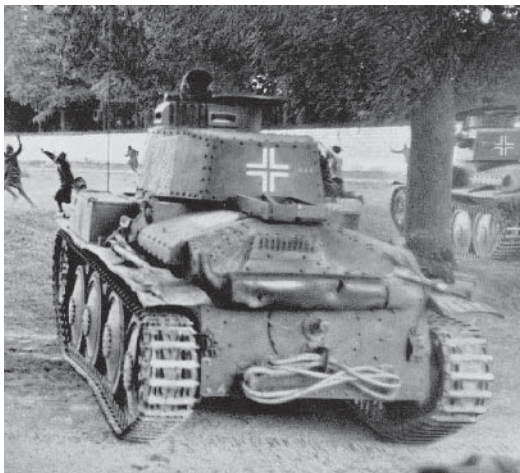
Franse soldaten geven zich over aan een Duitse tank.