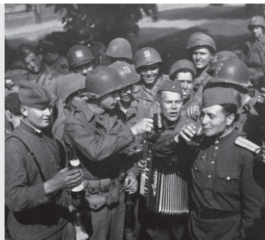
Amerikaanse en Sovjetsoldaten vieren hun overwinning op Duitsland.

Berlijn veroverden, pleegde Hitler zelfmoord in zijn bunker. Op 5 mei 1945, Bevrijdingsdag , kwam er een einde aan de oorlog in Nederland. Iedereen was blij dat de oorlog eindelijk voorbij was. Maar tegelijkertijd waren de mensen ook verdrietig: veel mensen hadden familieleden en vrienden verloren en er waren veel huizen, fabrieken en bruggen vernietigd.