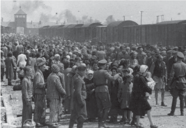
Joodse Hongaren worden op het perron van Auschwitz-Birkenau gescheiden (1944).