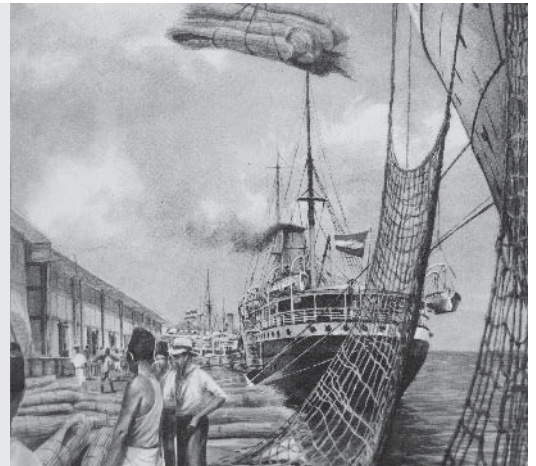
Inladen van rotan (palmstengels) in Nederlands-Indië (schilderij uit 1914).

werden gedwongen om producten zoals peper, tabak, suiker en rotan te verbouwen en voor een lage prijs aan Nederlanders te verkopen. Van rotan werden dan in Nederlandse fabrieken meubels gemaakt. Op die manier ging de meeste winst naar Nederland en kwam hier steeds meer industrie, terwijl de Indonesiërs armer werden. Andere grondstoffen uit Nederlands-Indië waren rubber, koffie en thee.