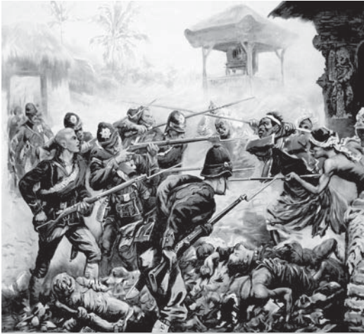
Gevecht van Nederlanders en Indonesiërs in Lombok, 1894.