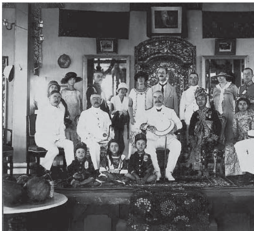
Hoge Nederlandse en Indonesische bestuurders op Bali (foto uit 1925).