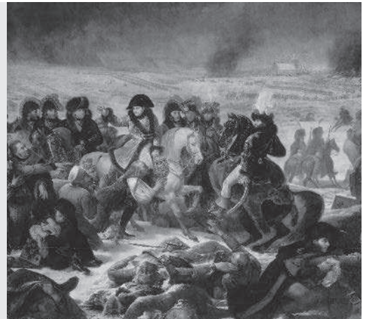
Keizer Napoleon Bonaparte rukt op met zijn leger.

Het werd winter. Er was niets te eten onderweg. Mensen en paarden vrozen dood in de ijzige koude. Deze veldtocht werd een grote mislukking. Napoleon werd op de terugtocht verslagen, maar hij kwam terug en pleegde opnieuw een staatsgreep. Toen hij daarna de veldslag bij Waterloo verloor van Groot-Brittannië, gaf hij zich over en werd verbannen naar het afgelegen eiland Sint Helena.