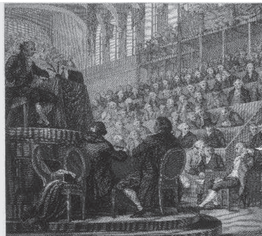
Het parlement stemt voor de doodstraf van koning Lodewijk XVI.

Ook Nederland had Frankrijk de oorlog verklaard. De regering was bang voor een revolutie in eigen land. Nederlandse opstandelingen vluchtten naar Frankrijk. Deze patriotten veroverden met behulp van de Fransen Nederland. De stadhouder moest vluchten en de Bataafse Republiek werd uitgeroepen.