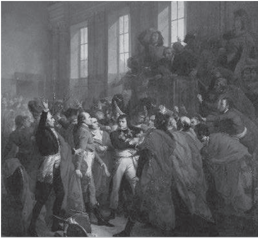
Het Franse parlement is boos op generaal Napoleon Bonaparte.