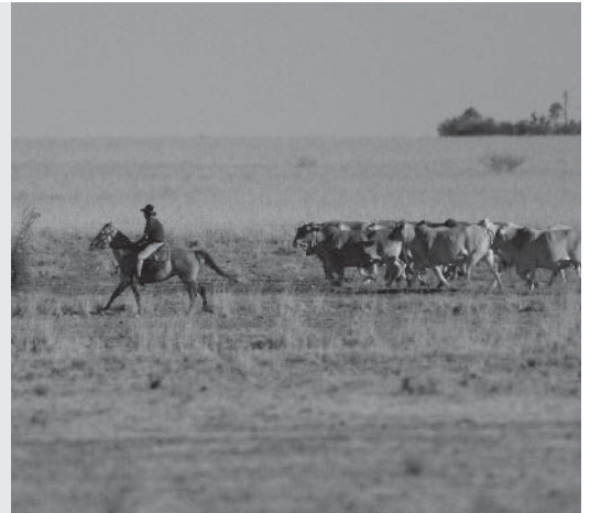
Een boer in de outback drijft zijn koeien bij elkaar.

Deze boerderijen liggen vaak honderden kilometers van een dorp af. Ook de boeren wonen vaak tientallen kilometers verderop. Daarom zijn er speciale voorzieningen voor deze afgelegen boerderijen. Ben je ziek en heb je een dokter nodig? Dan komt de dokter met een vliegtuigje of helikopter. Kinderen kunnen niet naar school, daarvoor zijn de afstanden veel te groot. Ze krijgen les via de radio of via internet.