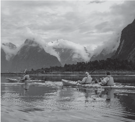
Toeristische activiteiten met behoud van de natuur.