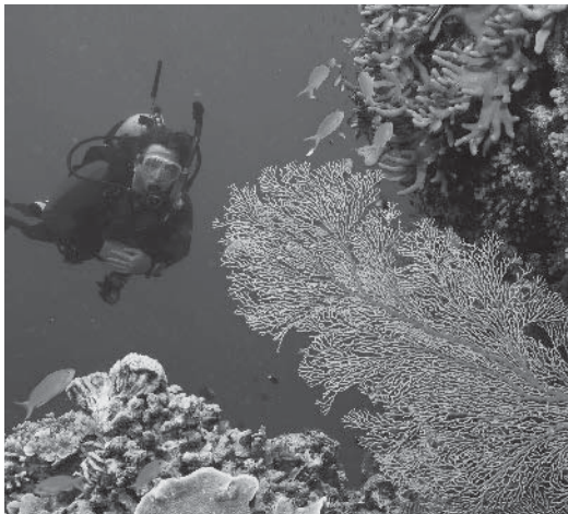
Toeristen komen naar Oceanië om het koraal te bekijken.