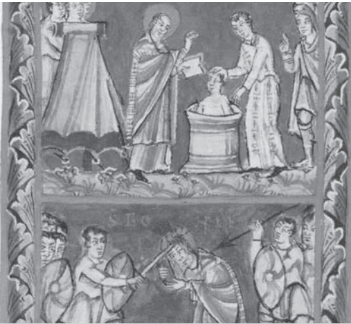
Bonifatius doopt iemand en wordt later in Dokkum vermoord.