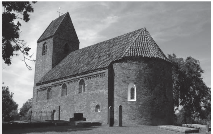
Deze oude kerk is gebouwd met dikke stenen muren en ramen met ronde bogen.

Germanen lieten zich wel bekeren, maar konden moeilijk wennen aan het nieuwe geloof. Bij hun oude geloof hoorden gebruiken die ze graag wilden houden. Dus besloot de kerk om die gebruiken op te nemen in het christelijke geloof. In het voorjaar staken de Germanen bijvoorbeeld altijd grote vuren aan, want rook zou goed zijn voor de vruchtbaarheid. Christenen lieten vuren aansteken op het paasfeest om te vieren dat Christus opgestaan was uit de dood. Op zondag kwamen de gelovigen naar de kerk. De pastoor las voor uit de Bijbel en vertelde de mensen hoe ze moesten leven. In de loop van de tijd ging de kerk een steeds grotere rol spelen in het leven van mensen.