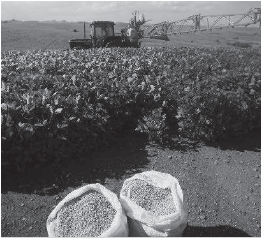
Waar eerst regenwoud was, wordt nu soja verbouwd en geoogst.