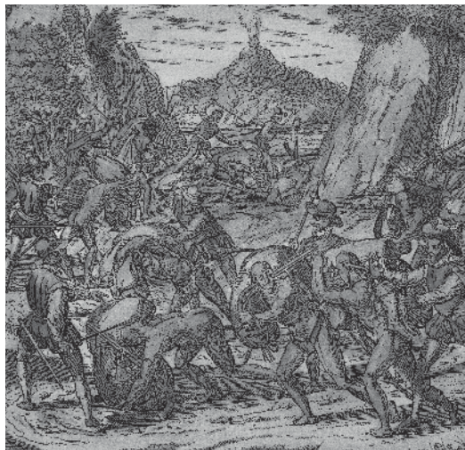
Spaanse kolonisten en indiaanse slaven.