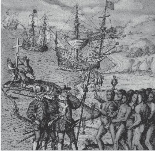
Columbus komt aan land in Amerika.