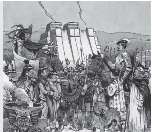
De koning van de Azteken ontvangt Cortéz in 1519.

Eén van de veroveraars was Hernan Cortéz. Hij veroverde het land Mexico, waar toen het machtige volk de Azteken woonden. Mexico werd daarna een Spaanse kolonie. Op die manier bezetten veel Europese landen stukken van Amerika en werden er de baas. De kolonisten brachten hun eigen godsdienst mee. In de Spaanse en Portugese kolonies kreeg daarom de katholieke kerk veel macht.