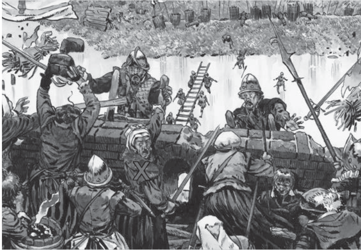
Haarlemse vrouwen onder leiding van Kenau vochten mee.