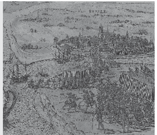
Watergeuzen veroveren het stadje Den Briel.

In het begin verloor Willem veel gevechten. Onverwachts veroverden de watergeuzen toen het stadje Den Briel. Daarna durfden steeds meer mensen de kant van Oranje te kiezen en konden de geuzen meer steden veroveren. Een daarvan was Delft, waar Willem ging wonen. Twaalf jaar later werd hij daar vermoord, in opdracht van Filips II.