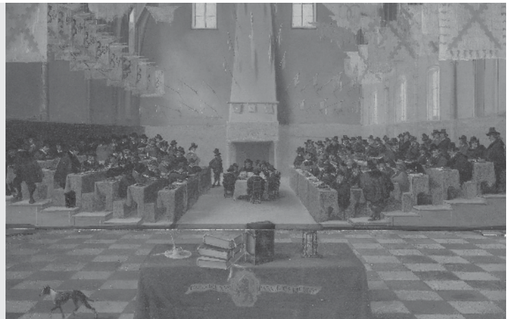
De Staten-Generaal in Den Haag was de vergadering van alle gewesten samen.

De gewesten vergaderden alleen over zaken die voor alle gewesten belangrijk waren, zoals het leger en de vloot. Ieder gewest regelde verder zijn eigen zaken. Een zoon van Willem van Oranje, prins Maurits, voerde het leger van de republiek aan. De zuidelijke gewesten bleven bij Spanje horen. Pas veel later werd dit ook een land: België.